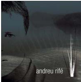
1a primavera (juny'05)