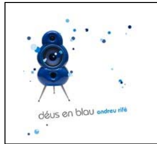
Déus en blau (Maig'06)