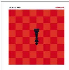
Escac al rei! (Febrer'08)